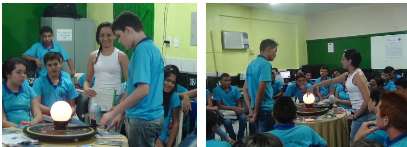
Participação dos alunos