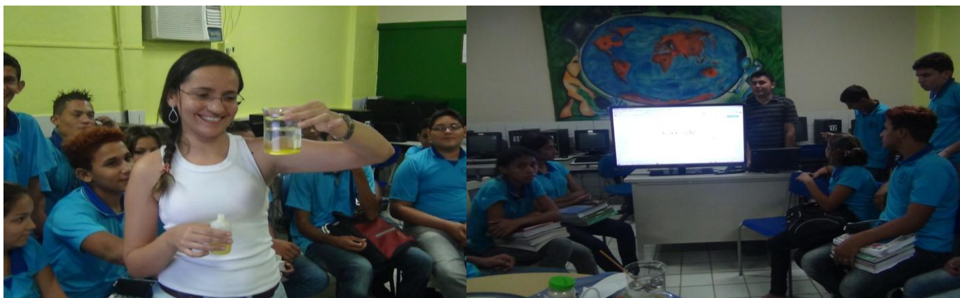
Apresentação dos professores